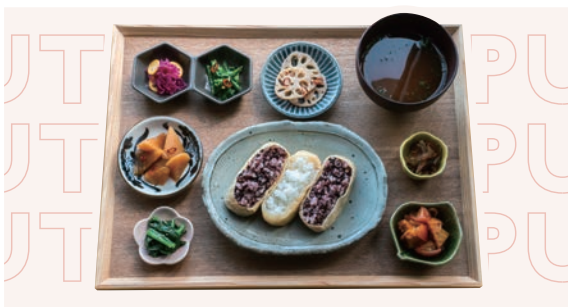
雑穀と白米の2色いなりと玉野おばんざい定食 ¥1,220