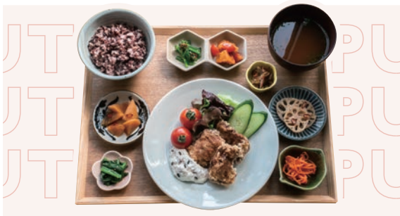
森林どりの唐揚げ定食 玉野雑穀タルタルソース ¥1,430