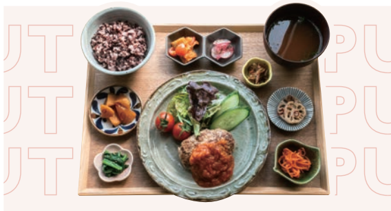
ピーチポークハンバーグ定食 みやまトマトソース ¥1,430