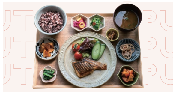
本日の瀬戸内地魚定食 ¥1,540