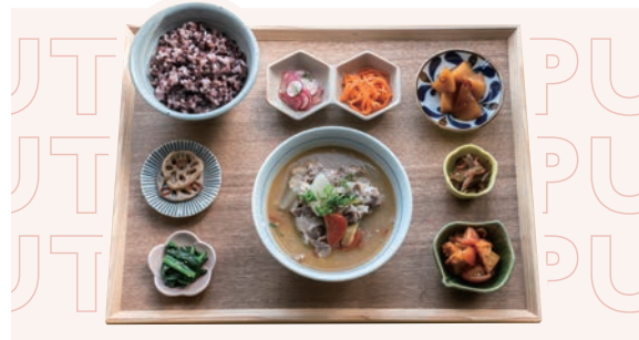
岡山野菜の具だくさん豚汁定食 ¥1,210