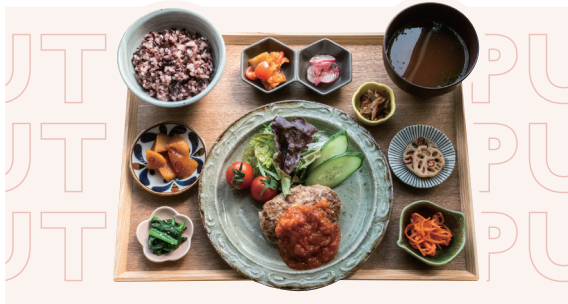
ピーチポークハンバーグ定食 みやまトマトソース ¥1,430