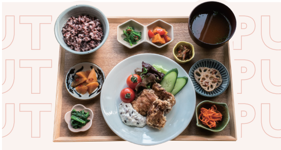
森林どりの唐揚げ定食 玉野雑穀タルタルソース ¥1,430