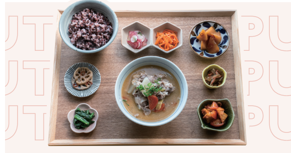
岡山野菜の具だくさん豚汁定食 ¥1,210