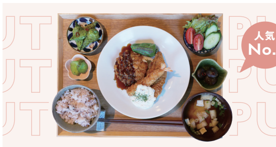
週替わり定食 (豚汁)