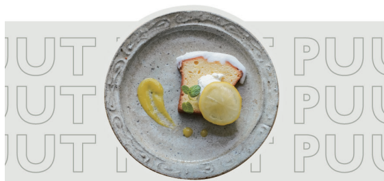
瀬戸内レモンパウンドケーキ ¥660