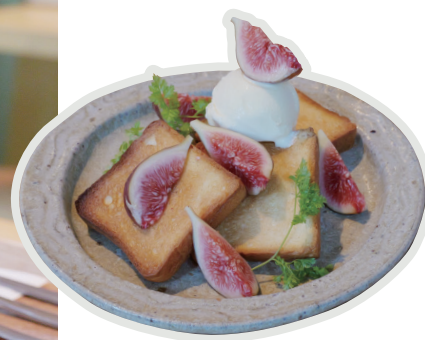
季節のハニートースト