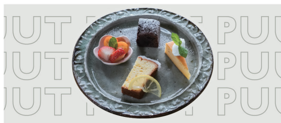
3種のミニスイーツ盛り合わせ ¥880