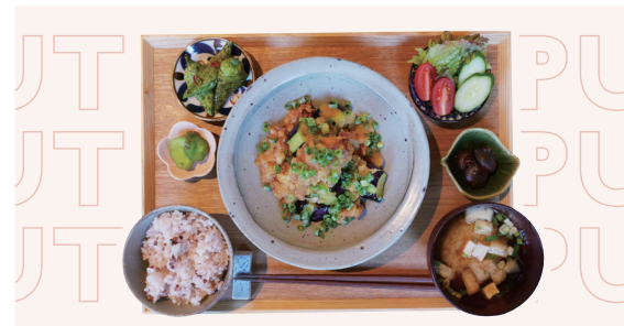
森林どりと季節野菜のみぞれ和え定食