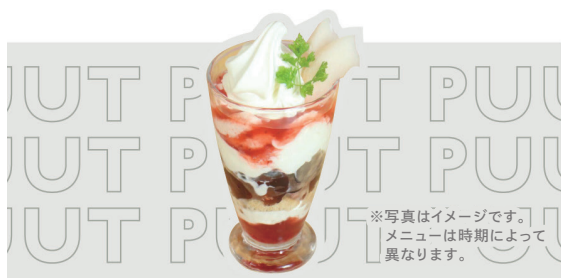
シェフの気まぐれパフェ ¥880