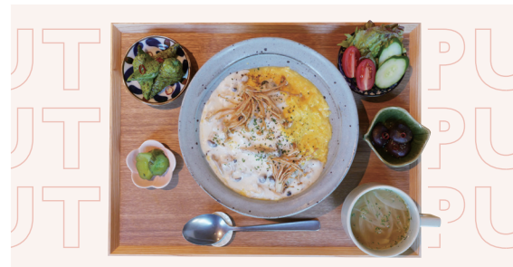
ふわとろオムライス定食 きのこクリームソース