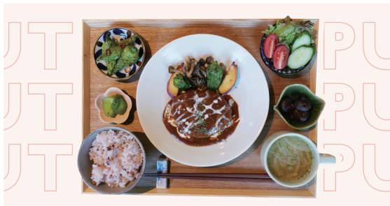
地野菜の煮込みハンバーグ定食