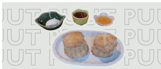
焼きたてスコーン 岡山フルーツジャム+クリーム付き