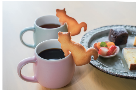
ドリンク みやまねこクッキー トッピング