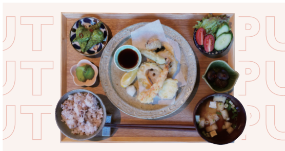
季節の天ぷら定食